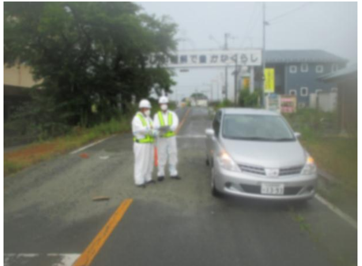
※避難指示区域におけるパトロール