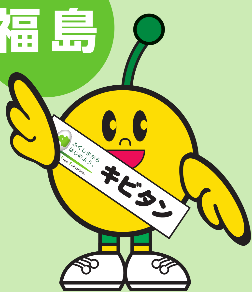
福島県復興シンボルキャラクター キビタン