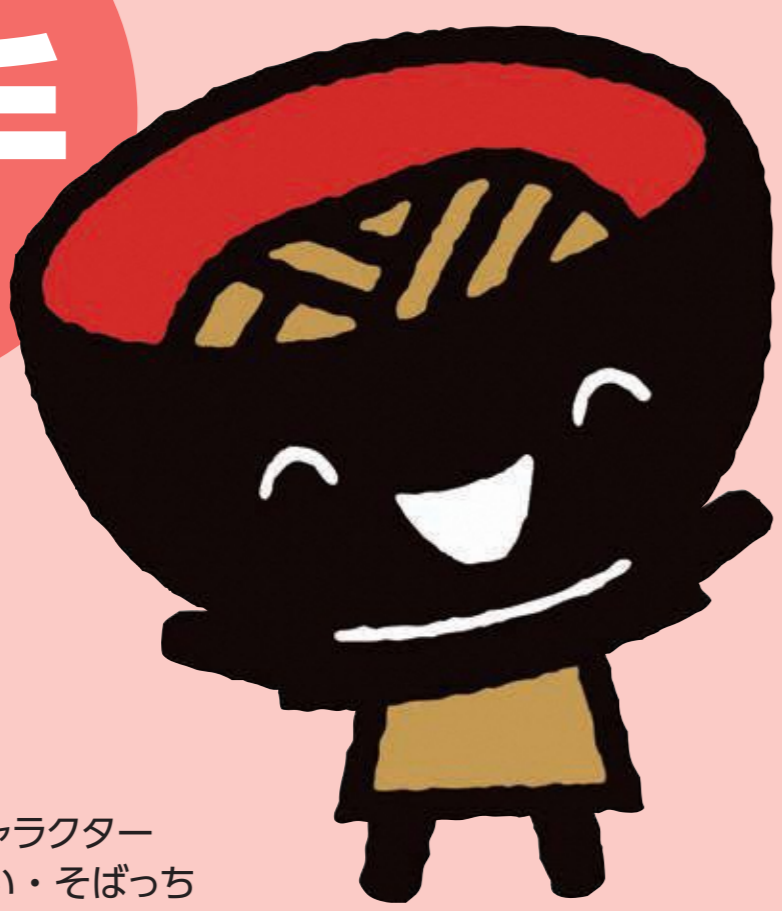
岩手県PRキャラクター わんこきょうだい・そばっち