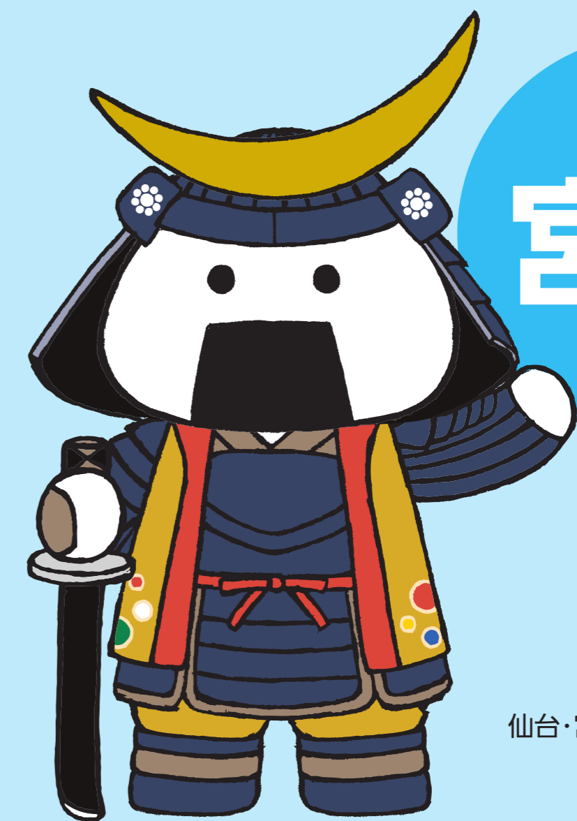
仙台・宮城観光PRキャラクター 「むすび丸」