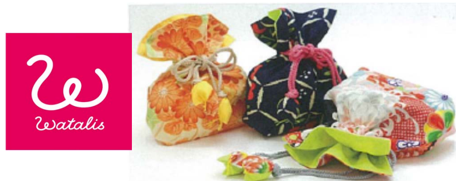
中古着物生地によるリメイク雑貨(FUGURO)

※かつて宮城県亶理町で返礼などの際に使用されていた、着物の残り布で仕立てた袋「ふぐろ」を再現。特に定まった呼称はなく、現在でも「ふぐろ」がなまって、「ふぐろ」と呼ばれている。