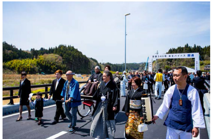
地元の皆さんで渡り初め