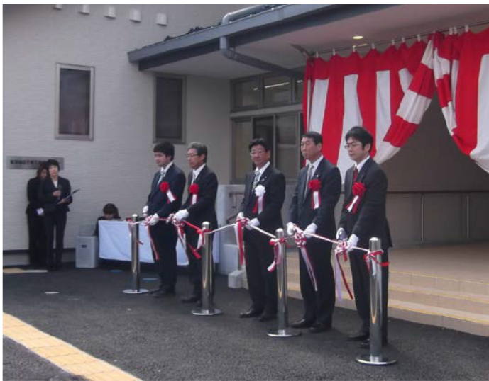
テープカットでお祝い