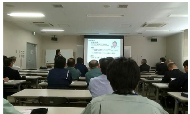
参加者は真剣に聞き入っていた

参加者からは貝への応用可能性等について質問が出ました。今後のとりくみに期待が持たれます。