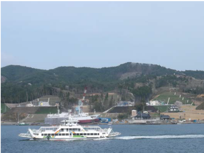
対岸から望む、大浦地区の防災集団移転と災害公営住宅建設地