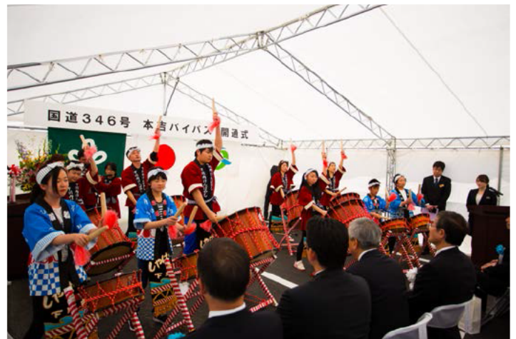
下川内剣ばやしの様子