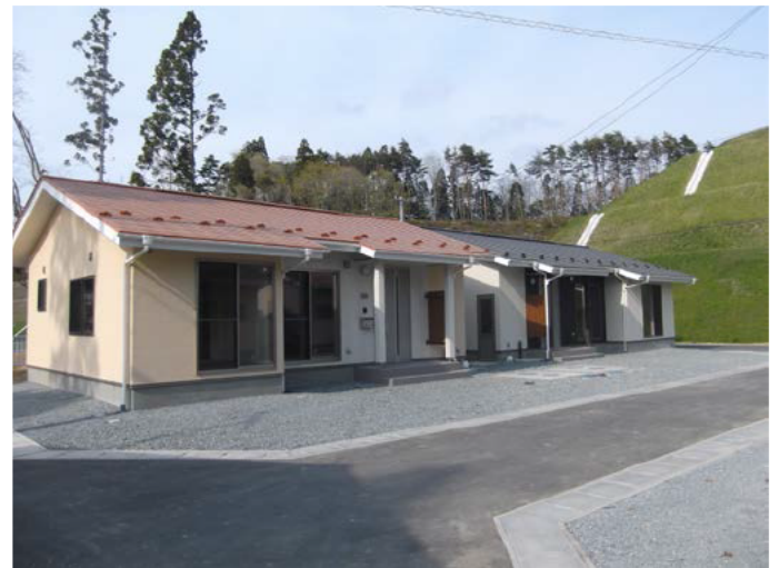
市営大浦住宅(左:55㎡タイプ 右:65㎡タイプ)