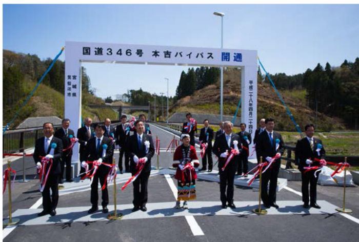
テープカットで開通を祝う