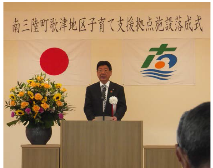
佐藤町長からもお祝いの言葉