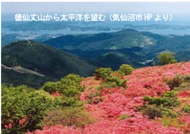
徳仙丈山から太平洋を望む

これまでに発行した「つちおと」は、復興庁ホームページで御覧いただくことができます。