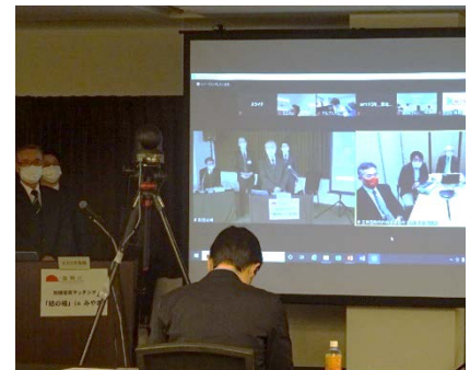
支援提案企業も仙台会場とオンラインから参加