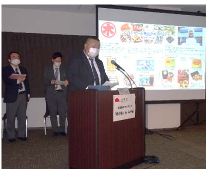
被災地域企業から、事業概要や課題などのプレゼンテーション

また、支援提案企業は仙台の会場参加だけでなく、オンライン開催ということで、関東、西日本の企業からも参加があり36社が集いました。ワークショップでは、被災地域企業から東日本大震災での復興途上の中、新型コロナウイルス感染症の拡大という社会状況の中で、従来の経営手法や販路だけでは厳しい等、経営課題の発表がありました。