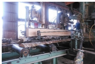
南部アカマツ製材の様様