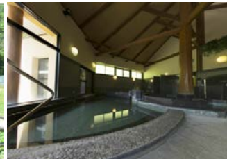
日帰り入浴施設の様子