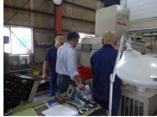
工場内での実技指導の様子