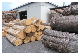
地域材「南部アカマツ」