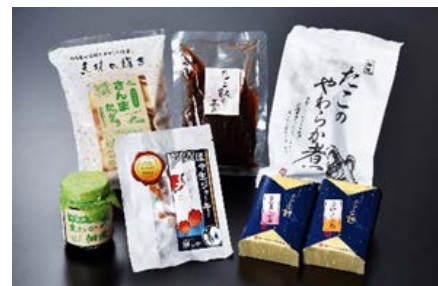
女川コラボセットの一例

復興庁では、引き続き「結の場」等を通じて、幅広い官民の連携により、民間の活力を活かして、産業の復興を加速する取り組みを進めてまいります。