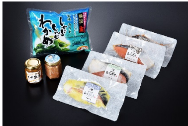
女川いっぱい！おなかはいっぱい！ あったかごはんセット

・結の場参加企業4社の商品からなる女川町コラボセットを2種新設。年間申込目標を6,000セットに設定し、各事業者と共に商品アピールを工夫しながら、女川町の魅力発信に努める。