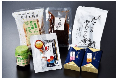
女川謹製！浜の母ちゃん おもてなしセット