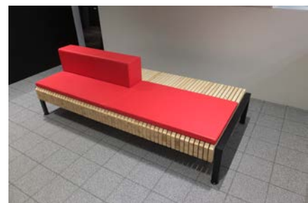
南部アカマツを使用した ロビーチェアの試作品