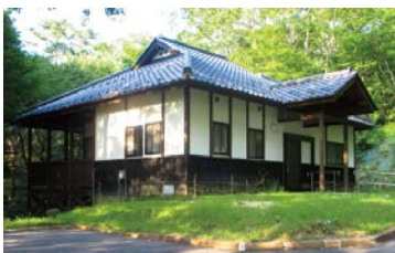
いわなの郷のコテージといわな釣り堀の様子