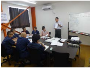
工場長、製造課長、各係長等とのディスカッションの様子