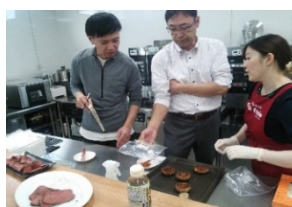
試作商品の開発の様様