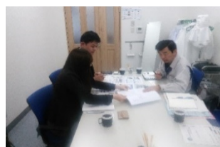
新商品開発に向けた打合せ