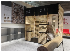
チェア・ブースの展示品