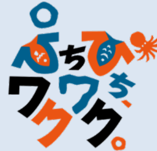
市場のあり方を表現する新キャッチコピー