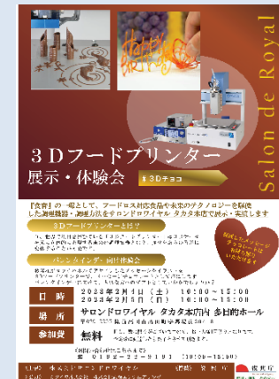
イベント告知ポスター