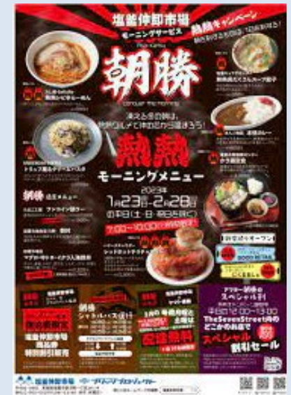
集客イベント『朝勝』PRポスター