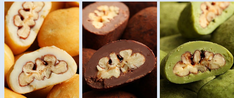
同社の販売するピーカンナッツチョコレート（左から「キャンディコート」、「ココアがけ」、「抹茶」）