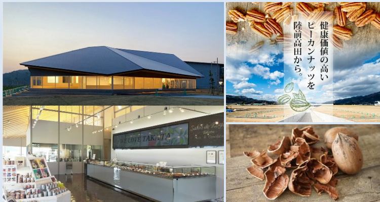
昨年開業したピーカンナッツ振興施設と同施設内のサロンドロワイヤルタカタ本店(左) / 産官学で推進するピーカンプロジェクト(右上) / ピーカンナッツ(右下)