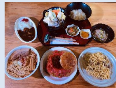
各店で考案提供された『朝勝』メニュー