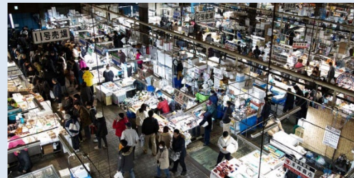
1966年建設のレトロな市場内部