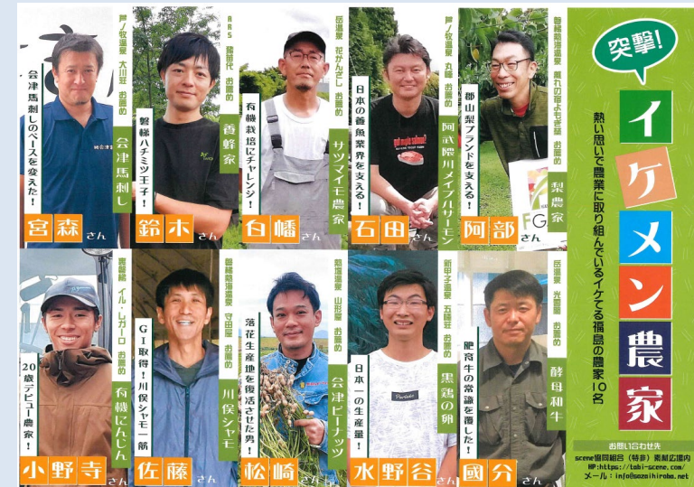
「イケメン農家」10名の紹介リーフレット