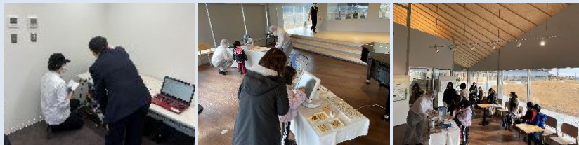
パティシエに対する3Dフードプリンターの指導により、自社での製作・操作実現