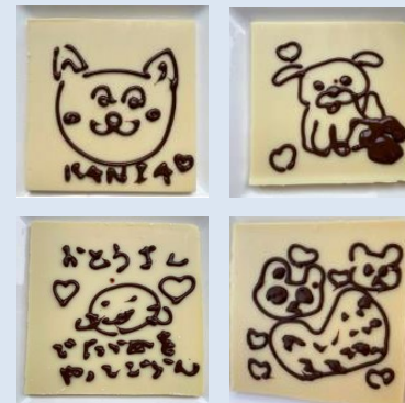
イラストからご家族へのメッセージなど多くのお客様に体験頂いた