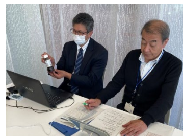
結の場の当日の様子