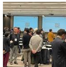
▲ 結の場当日の様子