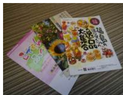
これまでに発行した通販カタログ

県内に105店、県外に8店を展開し、県内に顧客の大部分を持つ東邦銀行では、従来から取引先の中小企業へのバックアップをはじめ、地域への貢献を業務の一環としてきた。法人営業部の公務・地域振興室では、各種商談会や県産品・観光PRイベントの開催など、さまざまな取り組みを行ってきている。その姿勢は震災後の対応にも貫かれており、今回の通販事業においては、金銭的な支援のほか、全国の地銀をはじめとする金融機関や行政とのネットワークを活用し、カタログの普及に寄与した。また、銀行と地元中小企業との強い絆が地盤となり、復興への取り組みをスムーズかつスピーディに進めることができた。