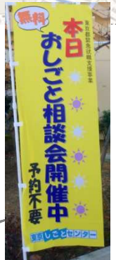
黄色いのはりが目印です！

交通案内 西武新宿線 鷺ノ宮駅より徒歩8分 (JR線高田馬場駅より急行1駅7分) 鷺ノ宮駅南口を出て左方向・川沿いに直進して徒歩8分、駅から5つ目の橋を右折して徒歩30秒。