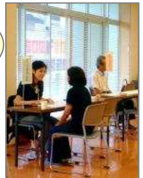
各地域での求人相談会