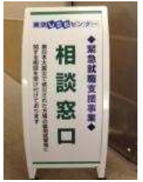
5階の相談窓口入口に看板があります。