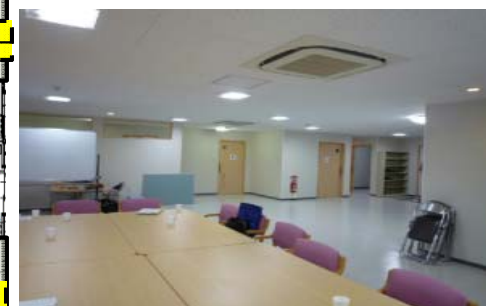
集会室・デイルーム