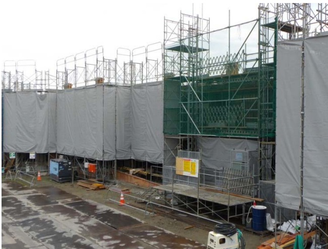
復興アルバム(定点観測写真)「田子西地区」