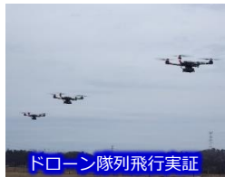
ドローン隊列飛行実証