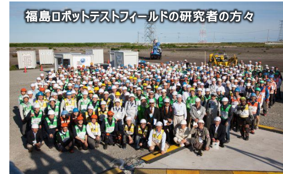
福島ロボットテストフィールドの研究者の方々