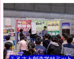
ふるさと創造学サミット