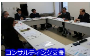
コンサルティング支援