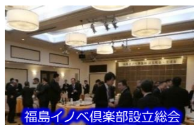
福島イノベ倶楽部設立総会