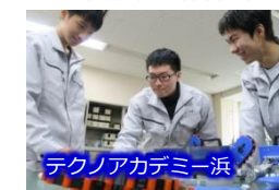
テクノアカデミー浜