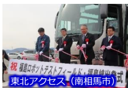
東北アクセス(南相馬市)

令和2年2月末現在、浜・中・会津の企業や金融機関、71の企業や金融機関、団体が会員として参画。