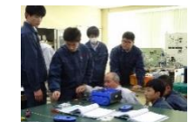
小産業技術高校×会津大学