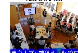
東京大学×楡葉町、飯館村

浜通り地域等で地元市町村と連携した教育研究活動を支援。18大学等、28プロジェクトを展開