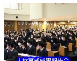
人材育成成果報告会