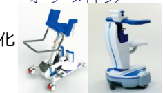
移動介助・移動支援機器等の実用化開発 (株)アイザック