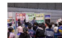
ふるさと創造学サミット (双葉郡8町村の小中学校等)