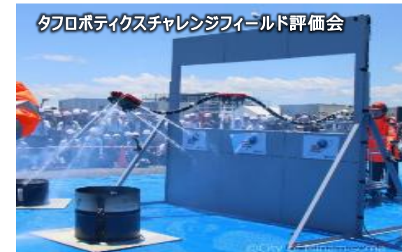
タフロボティクスチャレンジフィールド評価会