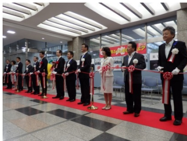
平成28年度開催セレモニー(於:経産省)