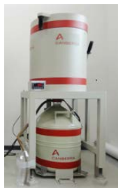
ゲルマニウム半導体検出器