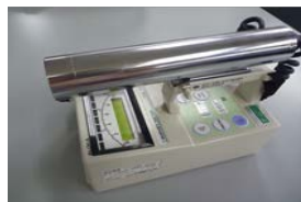
サーベイメーター