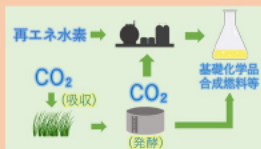
バイオ統合型グリーンケミカル技術 (イメージ)