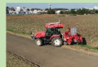
遠隔監視システムの開発 (超省力生産技術開発)