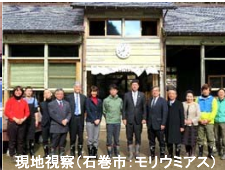
現地視察(石巻市:モリウミアス)