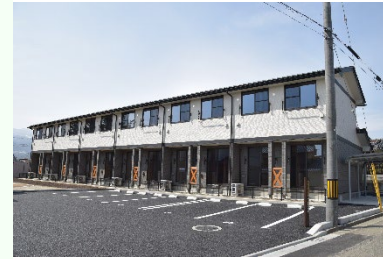
子育て定住支援賃貸住宅

福島市では、子育て定住支援賃貸住宅20戸を整備（H27.3）し、避難している子育て世帯の早期帰還を図っています。