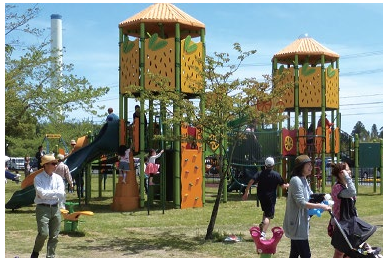
更新した遊具で遊ぶ子どもたち

広野町では、公園の遊具の更新（H26.9）を行い、子どもたちが安心して遊べる環境を整備することにより、子育て世帯の帰還促進を図っています。