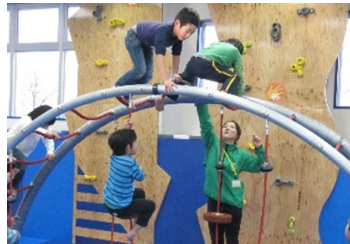
プレイリーダーの養成風景