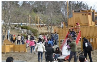
にぎわう屋外遊び場

本宮市では、運動施設のリニューアル（H25.7）や屋外の遊び場の整備（H26.12）を行うとともに、生き生きと遊ぶ力をより一層引き出す「プレイリーダー」の養成により、子どもたちの運動や遊びの機会の創出を図っています。