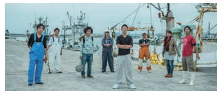
フィッシャーマン・ジャパン(石巻市) ようこそ海へ。漁業に革命をおこすトップランナーと過ごす夏