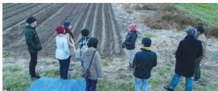
一般社団法人 イシノマキ・ファーム(石巻市) 有機無農薬栽培について学びながら地域の農業の現状を徹底リサーチ