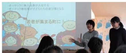
株式会社オーテック(女川町) 女川から将来のITベンチャーの卵を産みだせ!