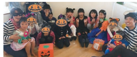
株式会社dreamLab(いわき市) ワクワドキドキが好きなお人、待ってます!