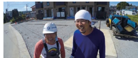
株式会社菅原工業(気仙沼市) 建設業のイメージ革新を目指す情報発信プロジェクト