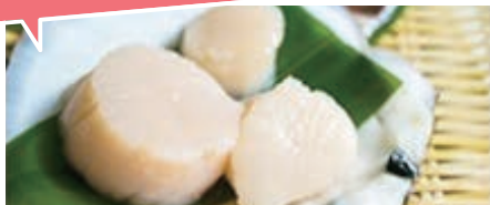
有限会社ヤマキイチ商店(釜石市) 日本一高いホタテで三陸の水産市場を盛り起こせ!