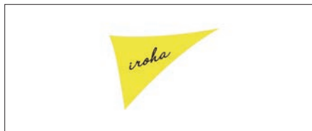
株式会社いろはデザイン(郡山市) 日本を担う福島発スーパーの基幹店舗のリニューアルデザインプロジェクト!