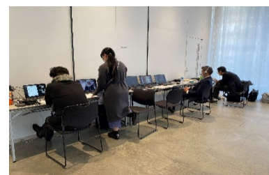
オンライン事務局