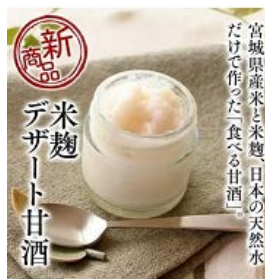
(株)ヤママサ 甘酒シャーベット