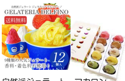
自然派ジェラート、マカロン (まがら洋菓子研究所(有))