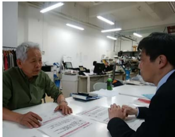
実行計画打合せの様様