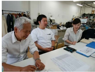
事務インタビューの様様