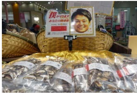
商品（原木乾燥シイタケ）