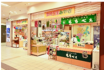
仙台駅 食材王国みやぎ