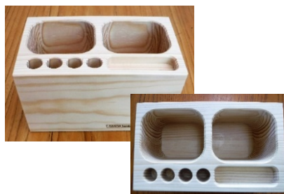
木製ペン立て (朝田木材産業(株))