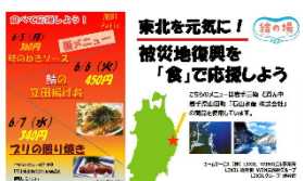
館内サイネージや掲示板などで告知

結果、予定の320食を上回る350食を完売。(2017年6月5日～7日：LIXIL本社ビル)