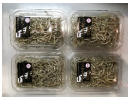
共通ラベルを貼付した小女子