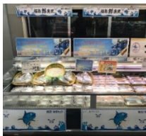
「福島鮮魚便」販売風景