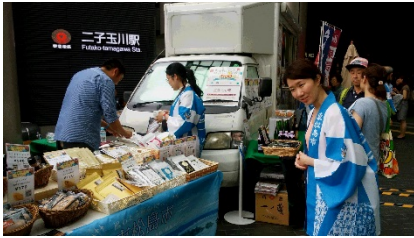
東北の魅力発見フェア in 二子玉川ライズ「東急ベル」ブース