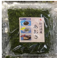
「松川浦産あおさ」販売風景