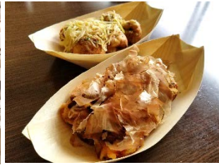
米金工房で提供されている商品 (たこ焼き、大判焼き、チーズドック)