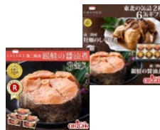
マルヤ水産(株)商品