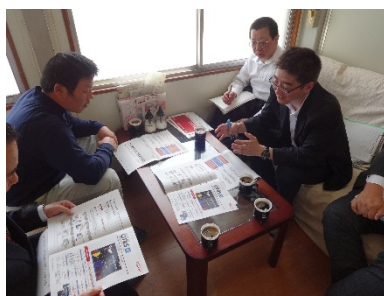
調査による「気づき」 の報告、助言・指導