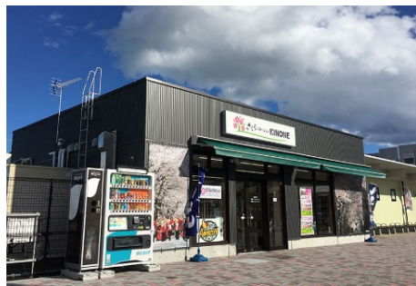
「さくらステーション KINONE」外観