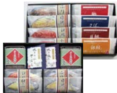
(有)丸七佐藤水産商品