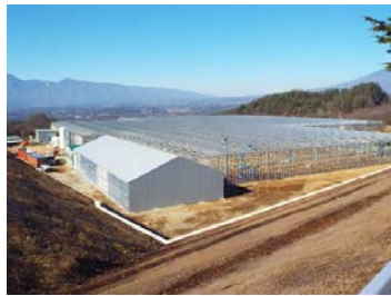
玉浦南部生産組合