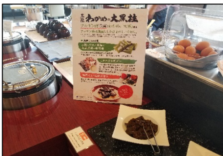
提供状況(メトロポリタン盛岡)