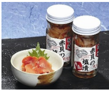
(有)マルタ水産商品