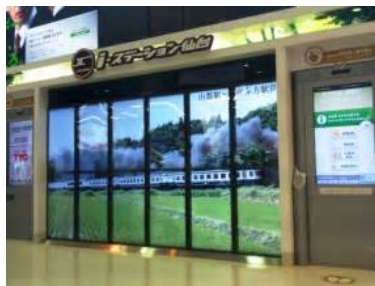
仙台駅 i-ステーション