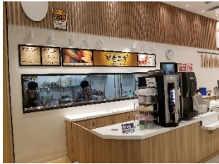
米金工房 (陸前高田店)