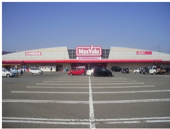
マックスバリュ店舗