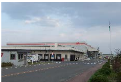
東北森永乳業(株)仙台工場