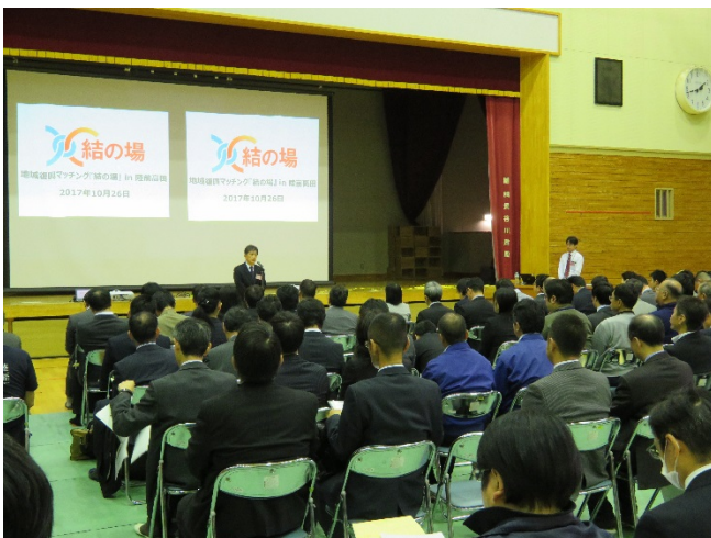
オープニングの様子

ワークショップでは、陸前高田グローバルキャンパス内にて被災地域企業と複数の支援提案企業がテーブルごとに分かれて、対話を行いました。実際の商品などを用いて被災地域企業の現状を理解してもらい、支援提案企業からは、質問や課題解決に向けたアイデア等が出されました。