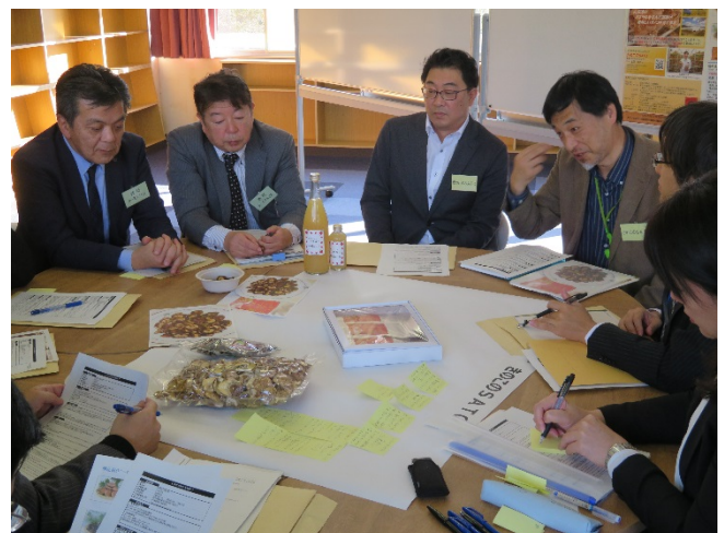
セッションでの対話の様子