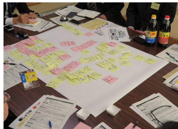
ワークショップで出されたアイデア

◇業種の異なる企業がこれだけ集まる場はなかなかない。他社の意見も参考となり、支援提案の内容が膨らんだ。社に戻ってどのような提案ができるか検討したい。