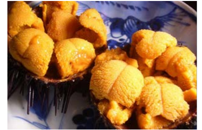
北三陸産キタムラサキウニ