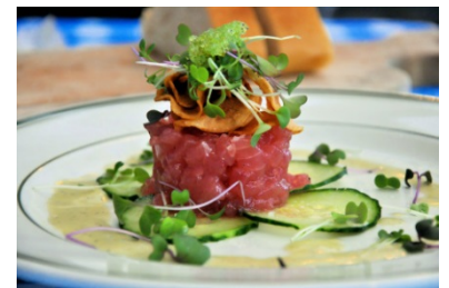
生食マグロ加工品