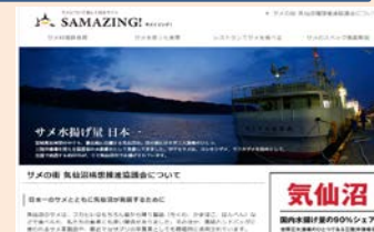
PR活動支援の一環として、HPを作成