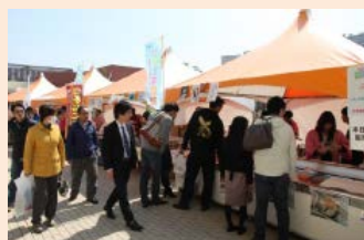
企業マルシェ開催風景