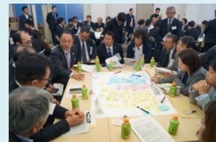
ワークショップで議論する様子