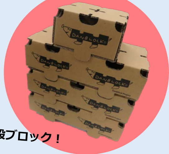
段ボール + ブロック = 段ブロック！