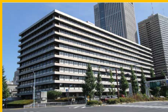
中央合同庁舎第4号館