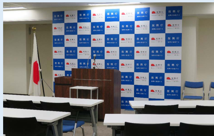
・復興庁記者会見室