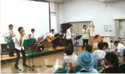
地域イベントに演奏する「モノクローム」メンバー。

体が不自由でも、高齢になっても、望む暮らしを実現していくために、リハビリに特化した事業を行う同法人の活動は、全国でも先進的な取り組みだという。「障害者の就労サポート事業にも興味を持っていて、その活動を松島町で始めたところですよ」と加える。今後は、起業に向けて準備を行うという。「祖母の言葉をきっかけにきた石巻ですが、ここに来なければ絶対にできなかった体験、出会いがたくさんあります。食べ物も美味いし魅力的な人が多いので、来て本当によかったです」と笑顔で語ってくれた。