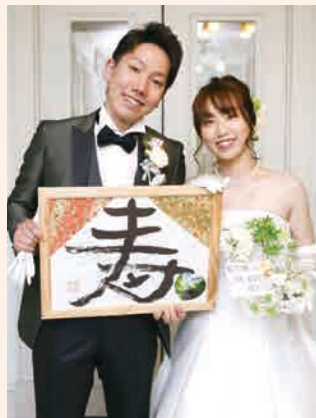
結婚を機に本籍も石巻に。

仕事もプライベートも軌道に乗る中、「故郷の島根が大好きなので、石巻で学んだ介護福祉の事業モデルを島根に持ち帰りたいと思うようになりました」。しかし、当時、同法人のコミュニケーションヘルス事業が丸森町で採用されるなど、広がりを見せ始めていた。「島根に戻るこ