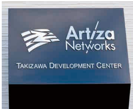
社名は、仏語で職人を意味する「アルチザン」と「ネットワーク」の合成。技術力ある職人が手を携えて高みを目指すイメージだ。

仕事がこれほど幅広く奥深いとは知りませんでした。もっと学びを深め、対応力を磨きたいです」と、さらなる成長を誓っていた。