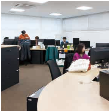
仕切りがなく自由度の高いオフィス。