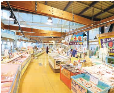
魚貝類や自社商品を販売する「気仙沼お魚いちば」。