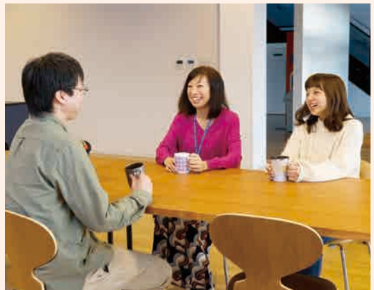
キッチン付きフリースペースで、同僚と談笑のひととき。

「でも、何かのきっかけで急に垣根がなくなるんです、とことん仲良くなるし、親切にし