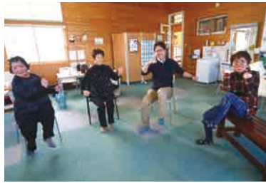
スタジオで利用者さんとプログラム中。

法人の利用者は被災者でもある。「最初の頃は震災の時はどうでしたかなんて聞くこともできず、まずは親しくなることから始めました」。腰を据え取り組むため、住民票を石巻に移しました。「僕も石巻市民ですと最初から言えるようにし