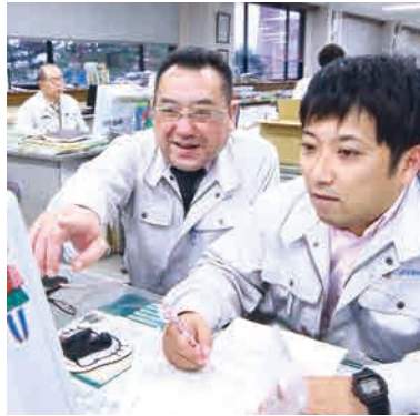
ダブルチェックで書類の不備を未然に防ぐ。

企業経営に必要なノウハウの修得を心掛けてきた。「歴史のある会社だけによいものは残しつつ、時代に合わせて変えるべき点は変えていきたい。そのために一歩ずつ着実に前に進まなければ」と今後の目標を語る。