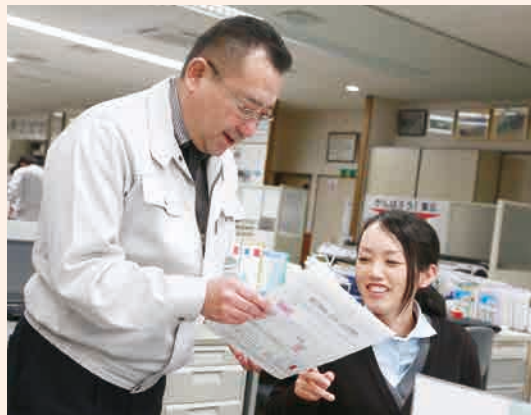
社員と打ち明け、コミュニケーションも円滑だ。

は、復興基盤工事という圃場 ぼじょう や住宅地の整備工事、河川の護岸工事、防災林の整備工事、除染など、多くの復興関連の現場を抱えている。「建設業は、復興の最前線に関わる仕事であり、それだけにやりがいのある仕事です。私もその一端を担うことで、少しでも復興のお役に立てればと思います」。