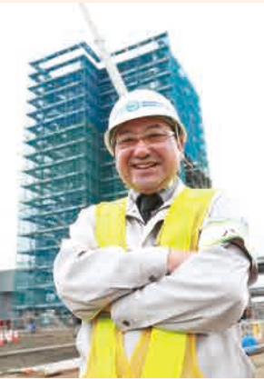
福島ロボットテストフィールドの建設工事現場。

ストフィールド」にあった。「福島ロボットテストフィールド」とは、「福島イノベーション・コースト構想」に基づき、経済産業省と福島県が南相馬市と浪江町の約55ヘクタールに研究棟やプラントなどを建設。災害対応ロボット、水中探査ロボット、物流やインフラ点検、災害対応などに活用できるドローンといった陸・海・空のフィールドロボットを主な対象に、実際の使用環境を再現しながら研究開発、実証試験、性能評価、操縦訓練を行うことができる施設だ。2019年完成予定で、完成すれば世界にも類を見ない研究開発拠点となると見られている。