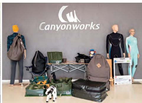
●若い女性が活躍 ●さまざまな自社ブランドを展開