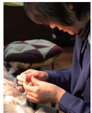
絹織物作りには高い技術と経験が要求される