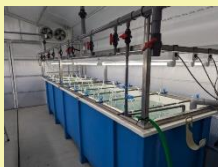
ブルーカーボンのコア技術開発