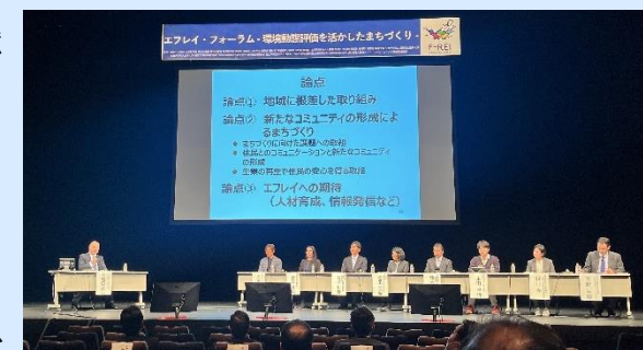
環境動態評価を活かしたまちづくりに関するフォーラム