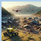
困難環境の作業ロボット・ドローン (イメージ)