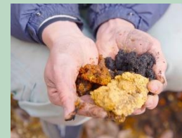
土壌再生の機序を解明し、土壌創製技術を確立