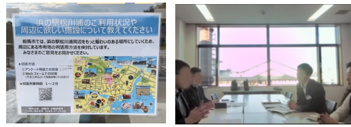
現地アンケート調査の様子 事業者との意見交換の様子