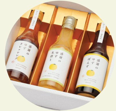
ふるさと納税 寄付管理・返礼品提案