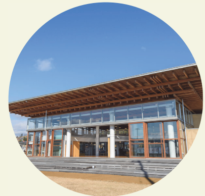
商業・交流施設の管理・運営