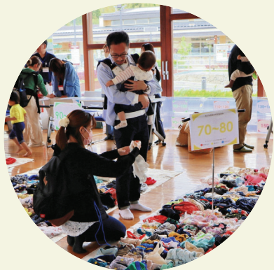
子育て世代との繋がりづくり