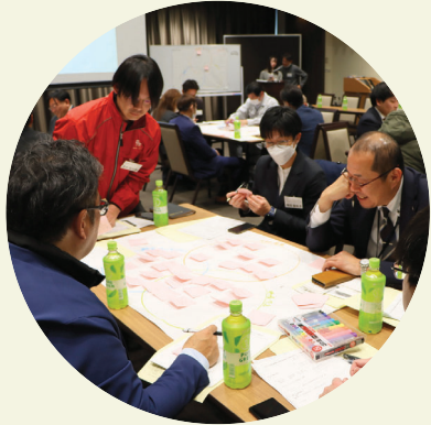
進出・立地企業間の交流 (課題共有ワークショップ)