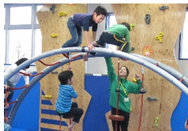
プレイリーダーの養成風景