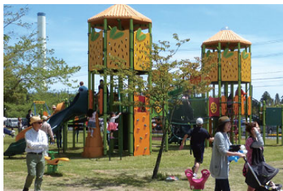
更新した遊具で遊ぶ子どもたち

広野町では、公園の遊具の更新（H26.9）を行い、子どもたちが安心して遊べる環境を整備することにより、子育て世帯の帰還促進を図っています。