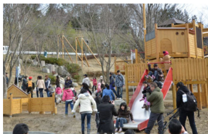
にぎわう屋外遊び場

本宮市では、運動施設のリニューアル（H25.7）や屋外の遊び場の整備（H26.12）を行うとともに、生き生きと遊ぶ力をより一層引き出す「プレイリーダー」の養成により、子どもたちの運動や遊びの機会の創出を図っています。