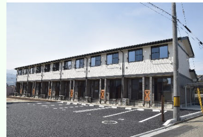
子育て定住支援賃貸住宅

福島市では、子育て定住支援賃貸住宅20戸を整備（H27.3）し、避難している子育て世帯の早期帰還を図っています。