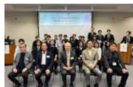
※メディア掲載の様子