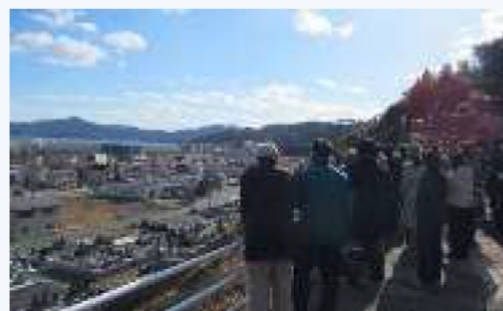
避難経路体験の様子