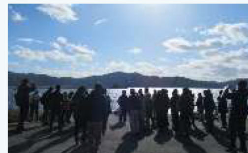
蓬莱島見学の様子