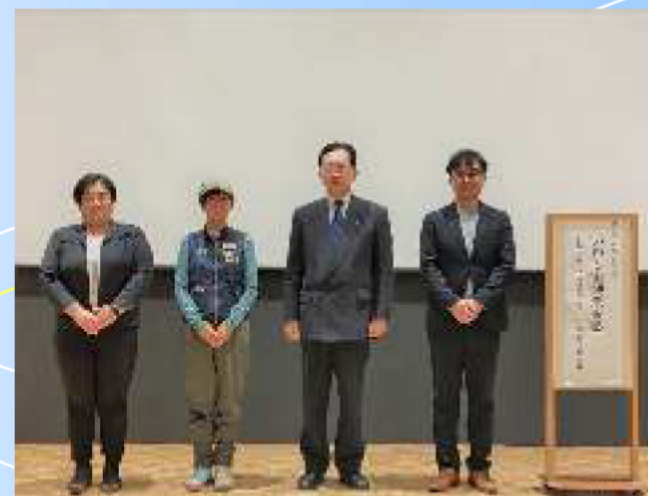
知事と講演者、事例報告者の皆さん