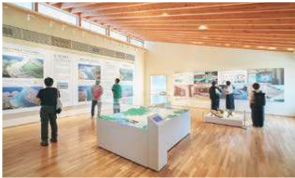
多目的スペースも設けられた「大川震災伝承館」。 丁寧に聞き取った住民の声も更新型の展示として発信し続けている。

施設③ キーワード □津波被害を知る □証言を聞く □復興を感じる □アートを見る