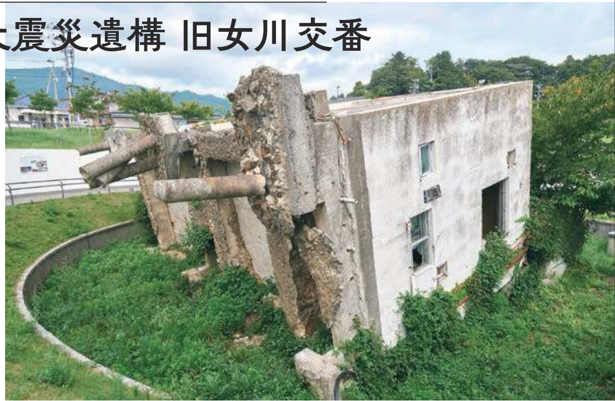
旧交番の屋根部分。紋章が付いていた形跡も。(2020年4月27日撮影)

女川町の最大津波高は14.8m。引き抜かれた土の杭からも、津波の力の大きさがわかる。見守り保存のため、自然に生えてきた草木も手を加えない。