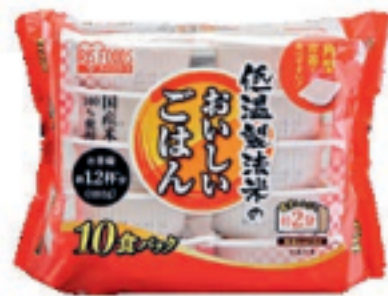
国産米100%のパックごはん「低温製法米のおいしいごはん ® 」(180g×10食)。米と水だけで作る、味と香りにこだわった商品は備蓄用にも最適。