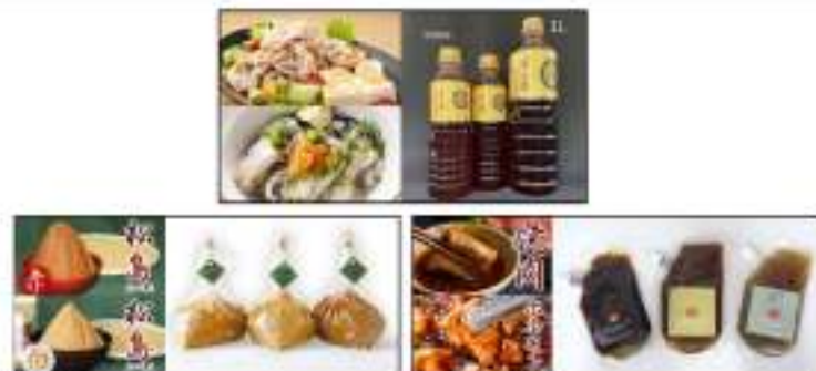
▲主力商品の生味噌、焼き肉用のたれ、ポン酢