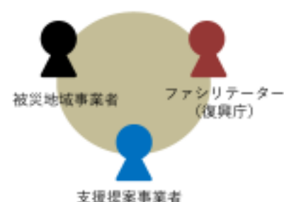
令和5年度のオンラインマッチングイメージ