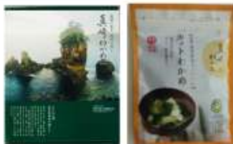
▲主力商品の真崎わかめ、カットわかめ