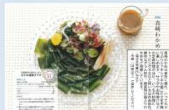
▲真崎わかめを活用したレシピ