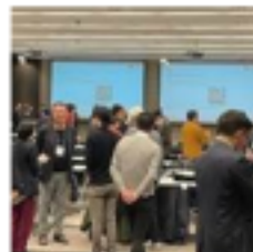
▲ 結の場当日の様子