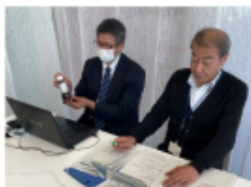
結の場の当日の様子