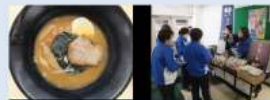
▲採用された食堂メニュー