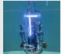
▲廃炉作業用の水中ロボット