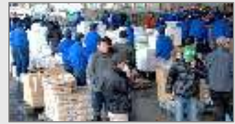
▲震災翌々日、停電のため市場の外に商品を並べている様子。顧客の要望を受け、そのまま食べられる商品を中心に卸した。