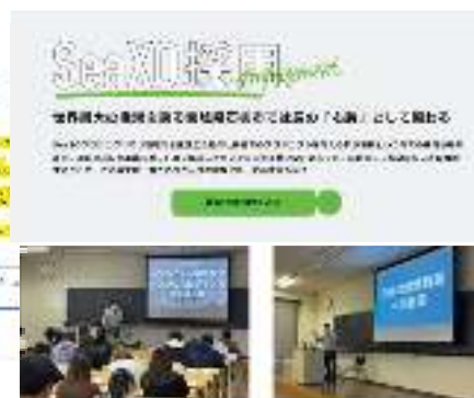
東北学院大学への取組の様子