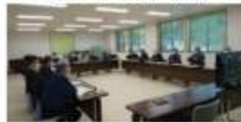
【漁業者との勉強会等】