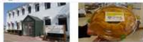
復興支援員等による、地域おこし協力隊の活動紹介