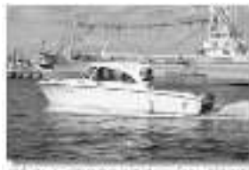
福島県いわき市沿岸地区に停泊した釣り船と漁船