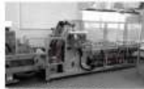
前浜町品田島村に寄贈した竹輪製機