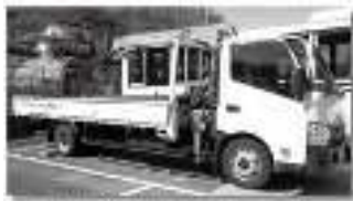
前浜町品田島村に寄贈した釣り船と漁船