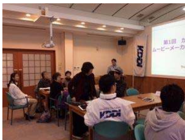
動画制作の様子2(12月2日)