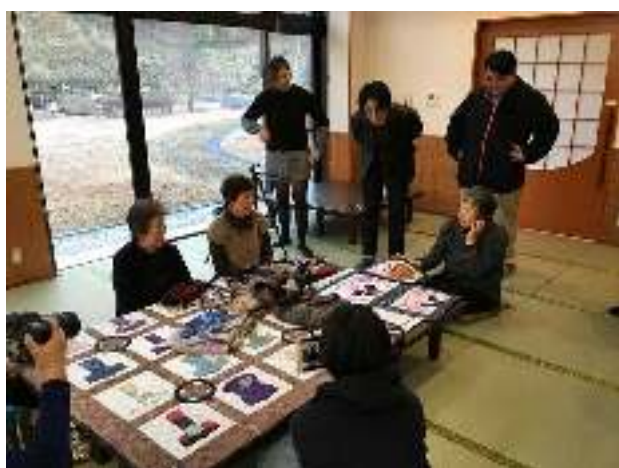
動画制作の様子1(12月2日)