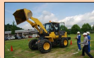
特別訓練コースの実施 (岩手県宮古市)