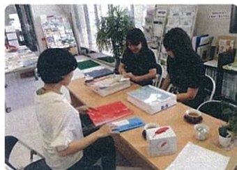
★ミーティングスペース