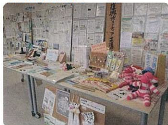
★情報掲示物スペース