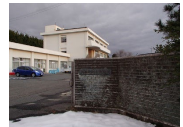
【木質バイオマス関連施設整備】