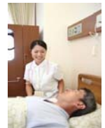
【介護福祉施設整備】