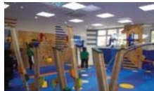
【全天候型運動施設整備】