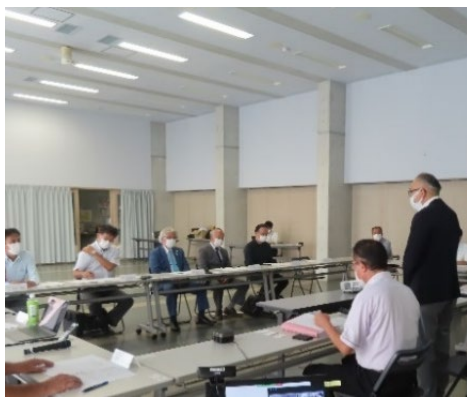
土地の有効活用に向けた 官民プラットフォームでの議論