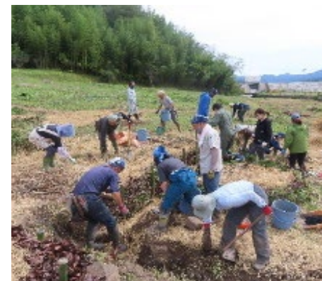
移転元地の緑化推進 ワークショップ