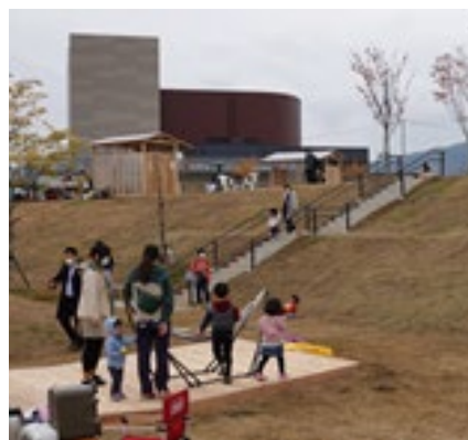
社会実験の実施による マーケティング