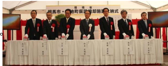
相馬市代行炉火納式(平成26年12月11日)