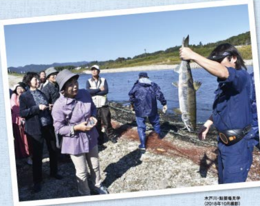
木戸川・鮭産場見学 (2018年10月撮影)