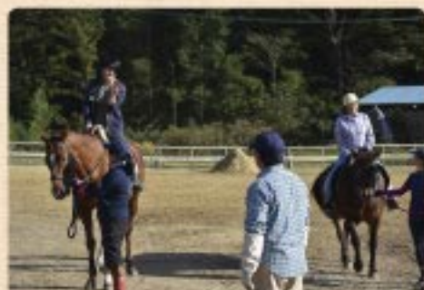
厩舎みちくさ(引馬体験) (2018年10月撮影)