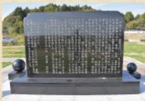
東日本大震災慰霊碑