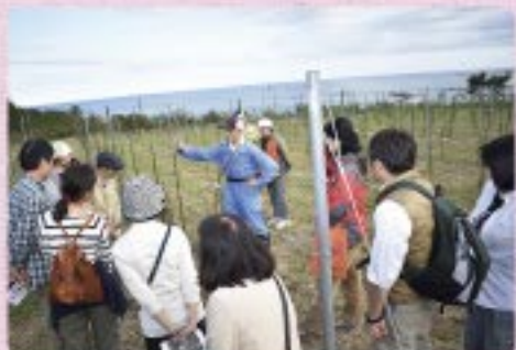
とみおかワイン葡萄栽培クラブ(2018年10月撮影)