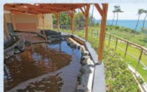
太平洋を眺望する露天風呂(天神御温泉)