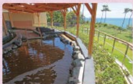
太平洋を展望する露天風呂(天神岬温泉)