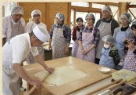
いわなの郷(そば打ち体験) (2018年12月撮影)