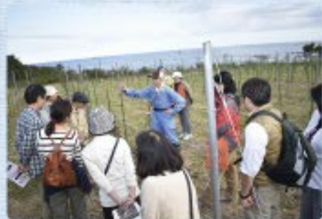
とみおかワイン葡萄栽培クラブ(2018年10月撮影)