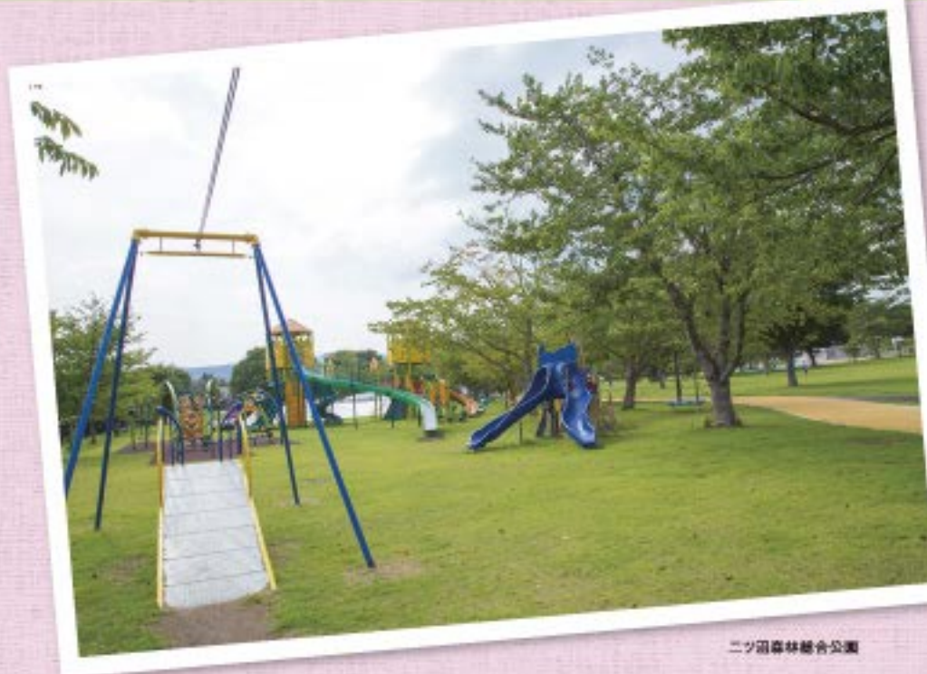
ニッ沼森林総合公園