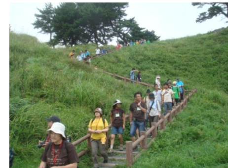
種差海岸歩道の利用状況